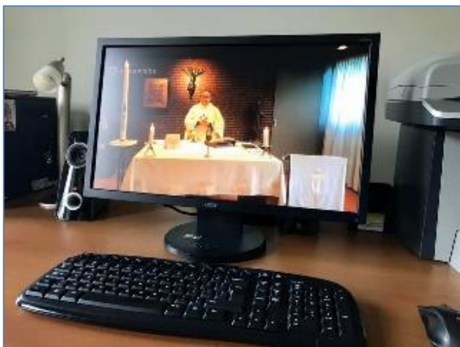
Pastoor René Schols actief via het beeldscherm te bekijken.

is er iedere ochtend om 9.00 uur Heilige Mis met Rozenkrans. Om 18.00 uur het avondgebed (vespers). De vespers zijn te volgen via het You Tube-kanaal: Heilige Mis Maastricht