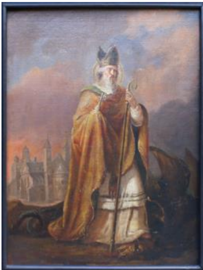
Sint-Servaas op een 19e-eeuws schilderij van Th. Schaepkens met op de achtergrond de Sint-Servaaskerk

Komt laat ons een loflied zingen Sint Servatius ter eer Dien wij waarlijk mogen noemen Bloedverwant van Onzen Heer.